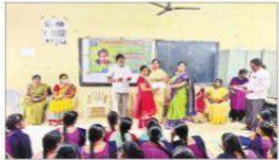
పోటీల్లో విజేతలకు బహుమతులు ప్రదానం చేస్తున్న అధ్యాపకులు

కంచికవర్ల సాంఘిక సంక్షేమ గురుకుల కళాశాలలో భారత గణిత శాస్త్రదినోత్సవం సందర్భంగా అతిథి ఉపన్యాసం జరిగింది. ఎస్ఆర్ఆర్ అండ్ సీవీఆర్ ప్రభుత్వ డిగ్రీ కళాశాల గణిత శాస్త్ర విభాగాధిపతి