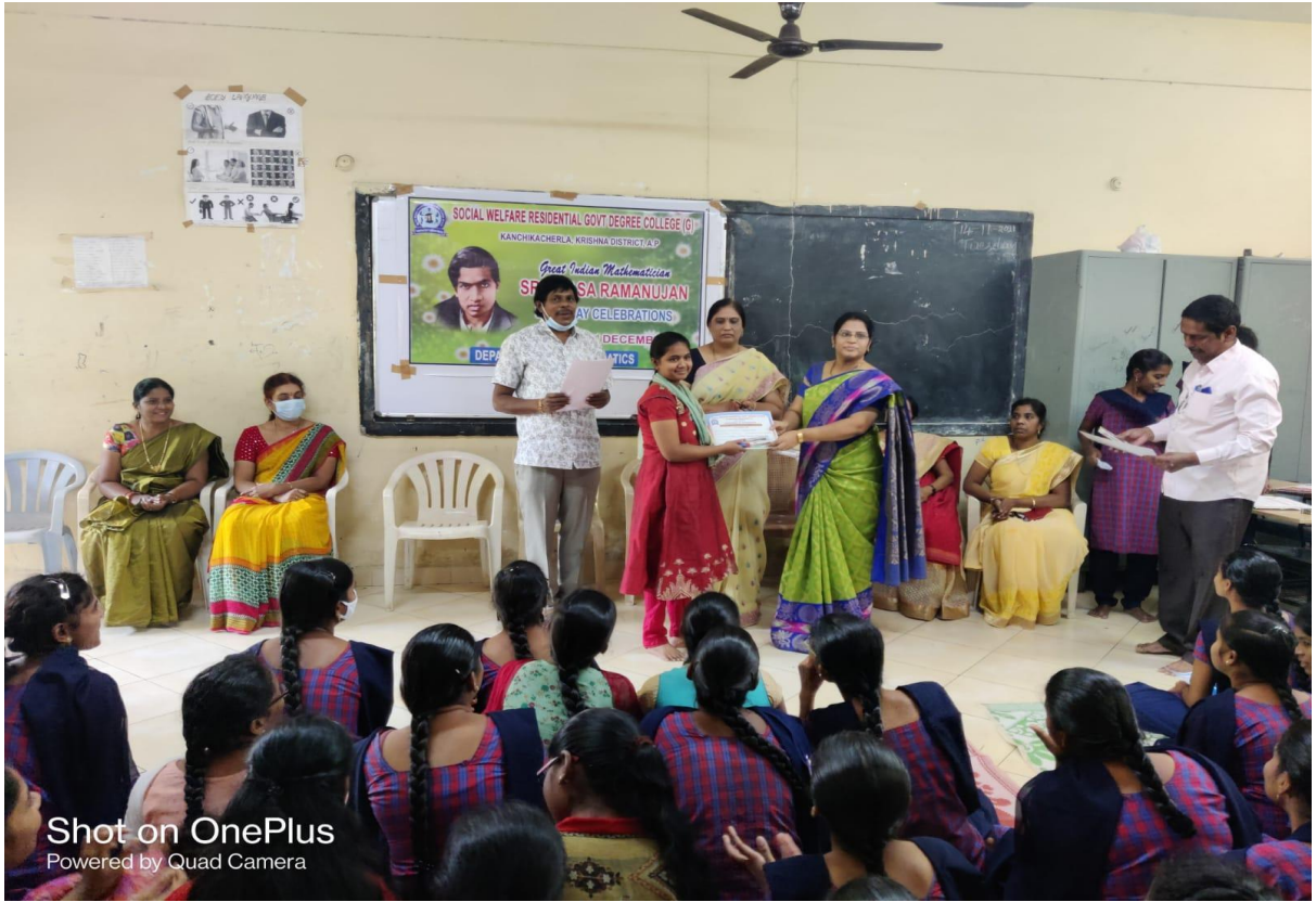
Prize distribution to winners